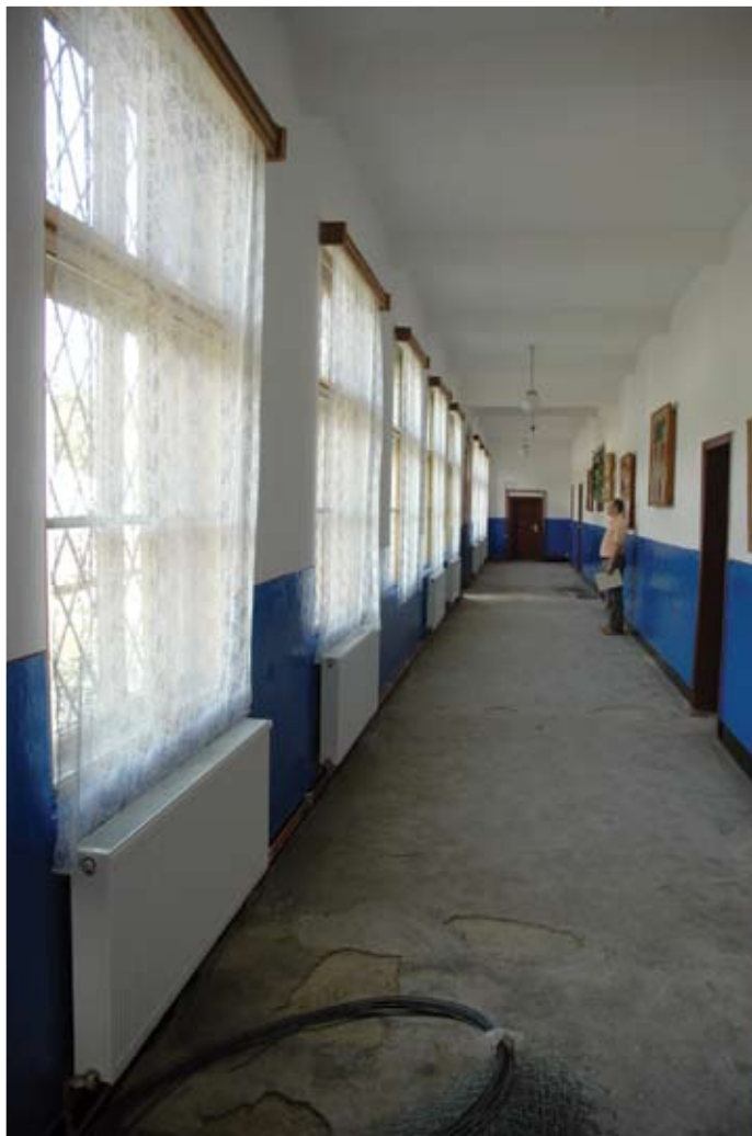
Bucur Costel, Școala Valea Vișeuului, 2006