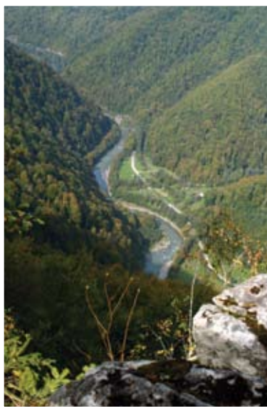
Pop Ioan, Defileul Vișeuului, 2006

Prin Ordinul Ministrului Mediului și Gospodăririi Apelor nr.570/06.06.2006 s-a constituit Consiliul Consultativ de administrare, organizat pe lângă Administrația Parcului Natural Munții Maramureșului, alcătuit din reprezentanți ai 49 de instituții, autorități și comunități locale care dețin cu orice titlu suprafețe în perimetrul Parcului Natural